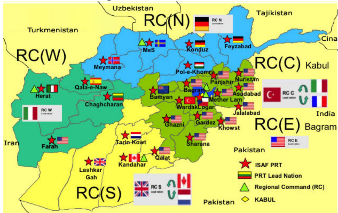
Grafico 2 – ISAF: Comandi Regionali e Localizzazione PRT

Attualmente il Comando di ISAF è affidato al Gen. (US) Stanley A. McChrystal dal quale dipende anche la condotta di Enduring Freedom (rispetto a quest'ultima operazione McChrystal risponde alla catena di comando americana).