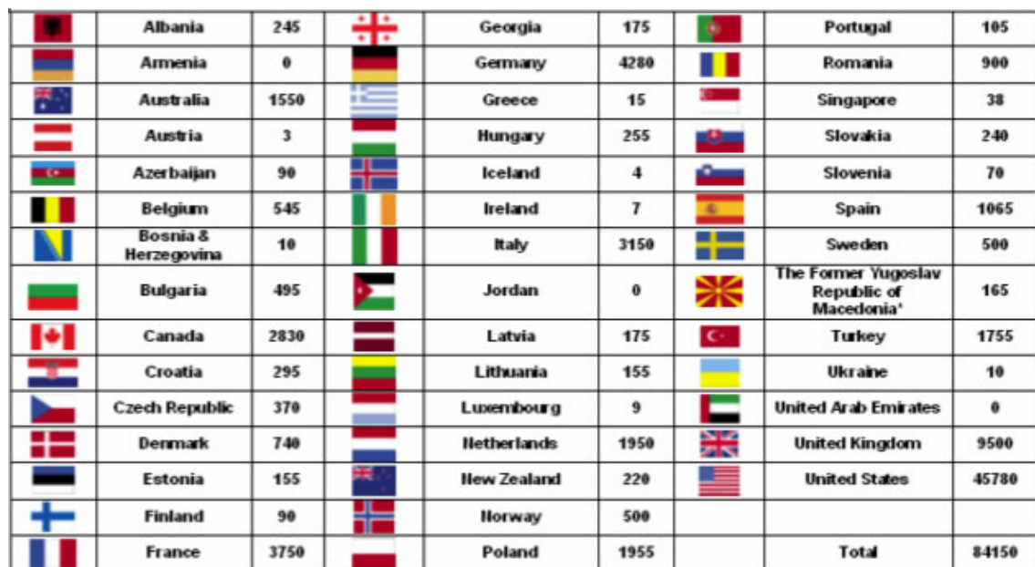
Tabella 1 – Truppe presenti in Afghanistan per nazione