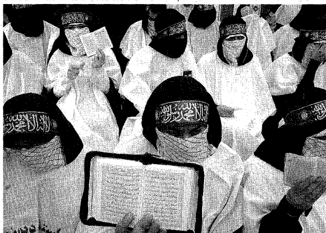
A Teheran Una cerimonia del 2006 in un cimitero di Teheran con donne iraniane che si votano ad attacchi suicidi